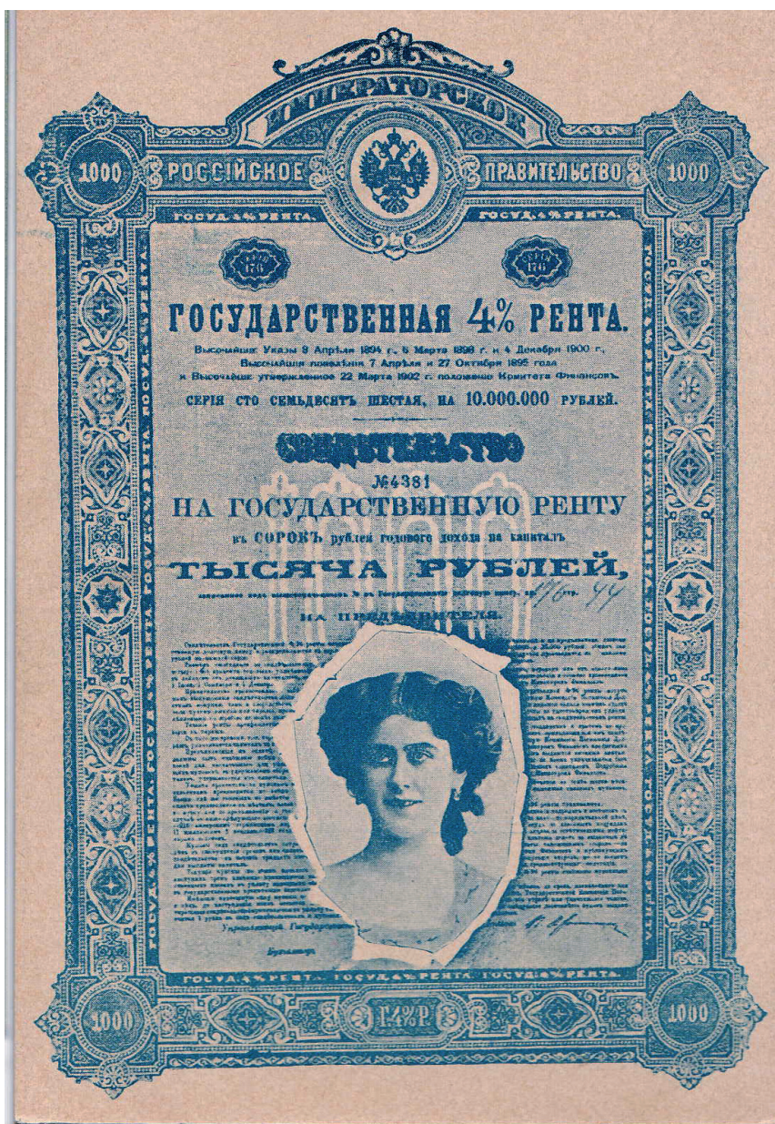
Открытка. Гламурная облигация государственной ренты со вставкой портрета Каролины Оттеро