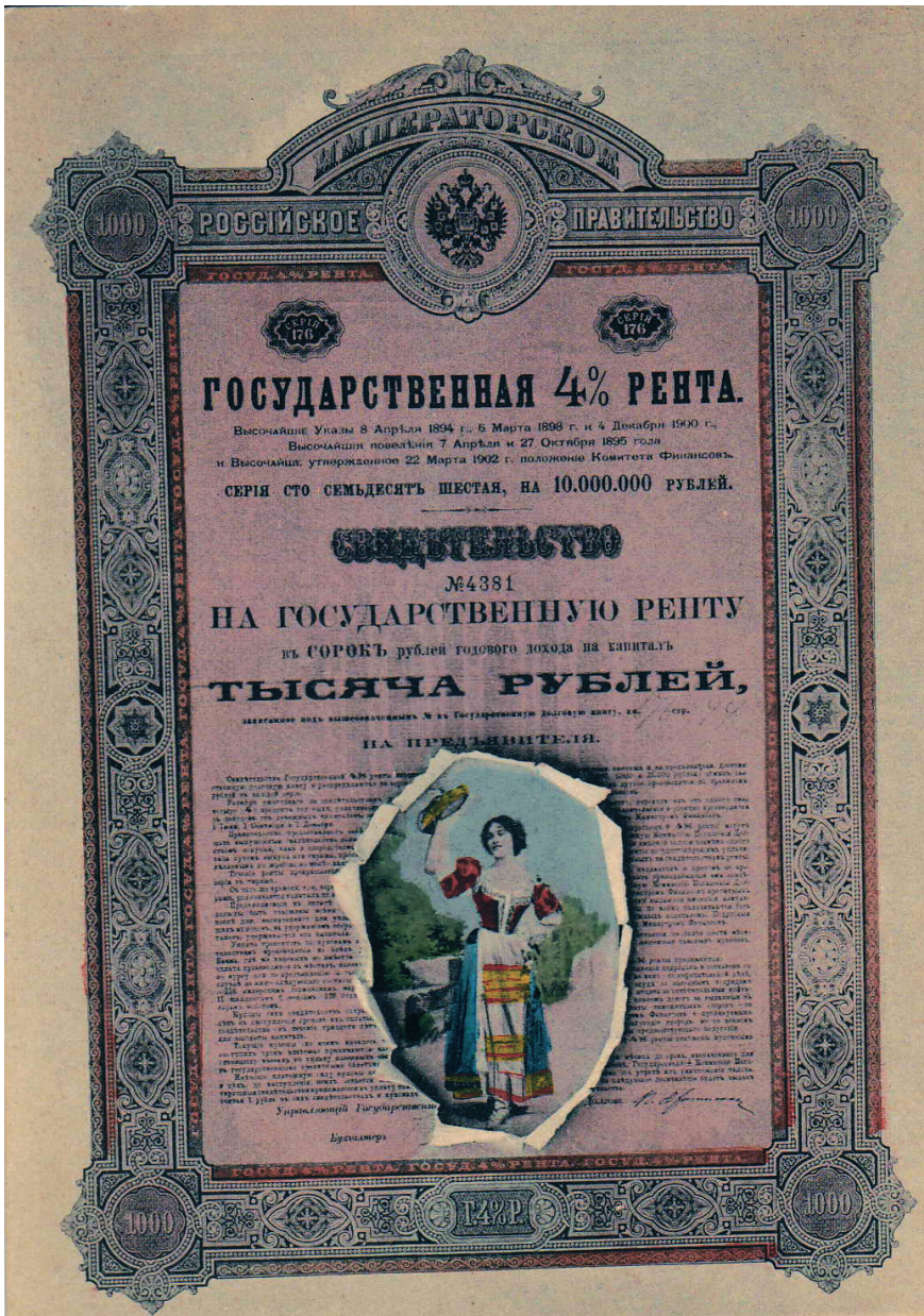
Открытка. Гламурная облигация государственной ренты со вставкой портрета Лины Кавальери