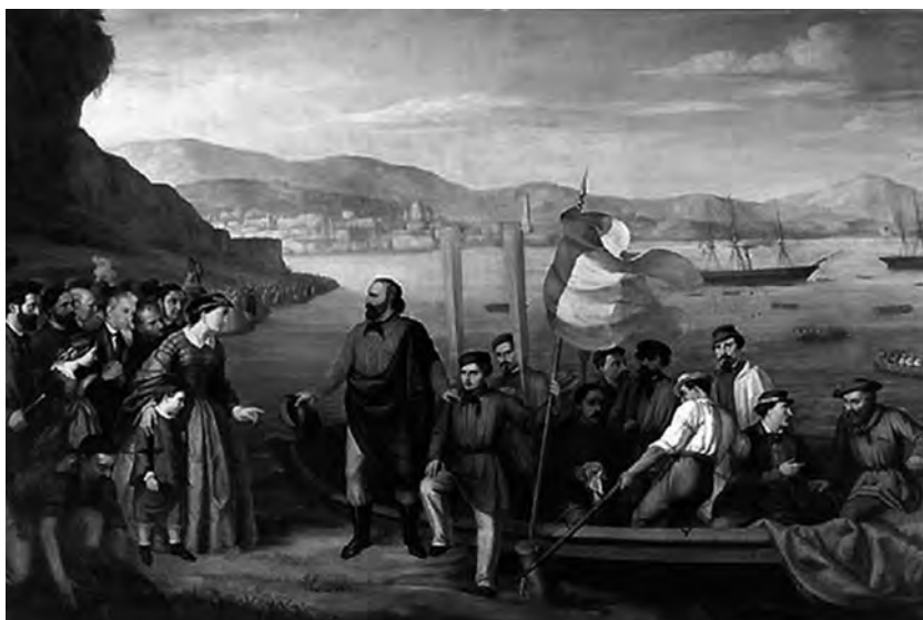
Джузеппе Гарибальди отправляется на завоевание Сицилии, 1860 г.

переговоры посол Джоаккино Пеполи предложил кандидатуру Флоренции, что давало возможность несколько приблизить правительственные структуры к более южным областям Италии и вместе с тем подчеркивало отказ Италии от Рима как столицы. Переговоры с папой затруднялись действиями Гарибальди, который бросил клич «Рим или смерть!» и собрал тысячи добровольцев для штурма папской столицы. Жесткая реакция на это Наполеона III заставила Виктора Эммануила на время отказаться от подобных планов. Попытки Гарибальди захватить столицу Папского государства дали лишний повод французам оставить в Риме свои гарнизоны и по истечении двухлетнего срока, предусмотренного «сентябрьской конвенцией».