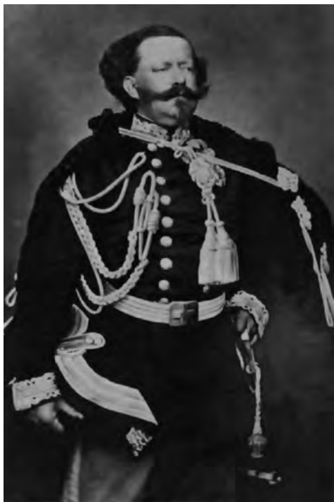
Король Виктор Эммануил II

национальная Австрийская империя, извечный противник Италии, признала Королевство только после поражения в австро-пруско-итальянской войне в 1866 г.