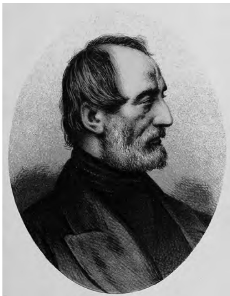
Джузеппе Мадзини, борец за объединение Италии