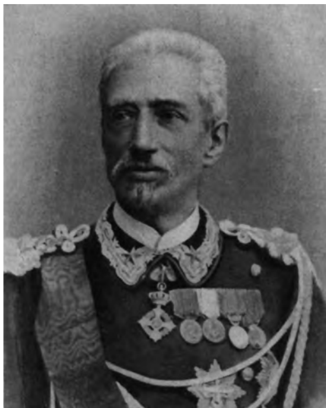
Карло Феличе Николис ди Робилант, министр иностранных дел Италии в 1885—1887 гг.

В течение многих лет «система Робилант» обеспечивала Италии роль посредника между Великобританией и державами Тройственного союза. Франко-русское сближение и обострившиеся англо-германские противоречия привели к меньшей расположенности британских политиков к контактам с Тройственным союзом. Кабинет Джозефа Чемберлена склонялся к сближению с Россией, вследствие чего Австрия прекратила всякие переговоры с Англией. Для итальянской дипломатии период действия «системы Робилант», предполагавшей наряду с континентальным Тройственным союзом создать тройственный средиземноморский союз, завершился.