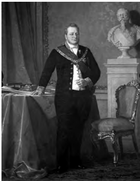
Камилло Бенсо ди Кавур, первый премьер Королевства Италии

В результате начавшейся в 1870 г. франко-прусской войны ситуация для Италии изменилась. Франция была вынуждена отозвать значительную часть своих сил из Рима. Ухудшило положение папского Рима и то, что Бисмарк приступил к проведению политики «культур-кампа», направленной против католической церкви. От итальянского правительства он потребовал ограничить свободу передвижения главы РКЦ. После поражения Франции итальянское правительство приступило к подготовке военной кампании для взятия Рима. Папа обратился к европейским государствам с просьбой защитить его от угроз со стороны Италии, но те либо не ответили, либо ограничились заявлением о невмешательстве. 20 сентября 1871 г. 50 тысяч солдат пяти итальянских дивизий подошли к стенам Рима. Им противостояло 13 тысяч вооруженных солдат папской армии и 3,5 тысячи добровольцев. Артиллерийскими залпами итальянцы разрушили стену в районе Порты Пиа, вошли в Рим, и через несколько часов командующий папскими войсками заявил о капитуляции. 2 октября в Риме и окрестностях, как ранее практиковалось и в других присоединяемых к Сардинскому королевству государствах, был проведен плебисцит. Многие преданные католики последовали призыву Ватикана не