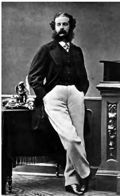
Висконти Веноста, министр иностранных дел Италии в 1863–1867, 1869–1876, 1889–1901 гг.

льянской Зеленой книге 5 , посвященной абиссинскому вопросу. К концу века стало также известно содержание секретного договора о «перестраховке», заключенного еще в 1887 г. Бисмарком с Россией и не доведенного до сведения союзников. В 1896 г. возглавить Консульту 6 вновь возвращается Висконти Веноста. С его приходом внешнеполитический курс Италии обретает новые черты. Висконти Веноста никогда не симпатизировал Бисмарку. Он прежде всего стремился наладить отношения с Англией и уладить споры с Францией. Его намерения разделял и Виктор Эммануил III, взошедший на трон в 1900 г. после убийства его отца короля Умберто I. Известные симпатии Виктора Эммануила III к Англии впоследствии позволили ему выступить в роли арбитра в делимитации границ между Бразилией и Британской Гвианой и между колониями Великобритании и Португалии.