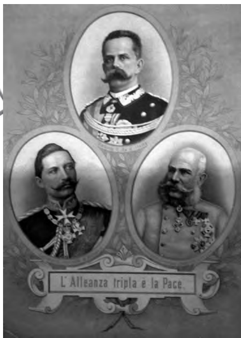
Итальянская открытка, пропагандирующая Тройственный союз как гарантию мира

Тройственный союз обязал Италию начать военные действия в случае неспровоцированного нападения Франции на Германию или в случае французской и русской агрессии против Австрии. Если же одна из сто-