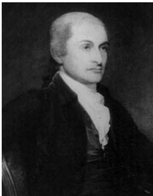
Государственный секретарь Джон Джей

ческие решения принимались Конгрессом двумя третями голосов. При частом отсутствии кворума и фракционности данного органа это приводило к затягиванию, а то и блокировке многих решений.